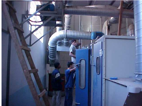
Maliber – Itatiba/SP