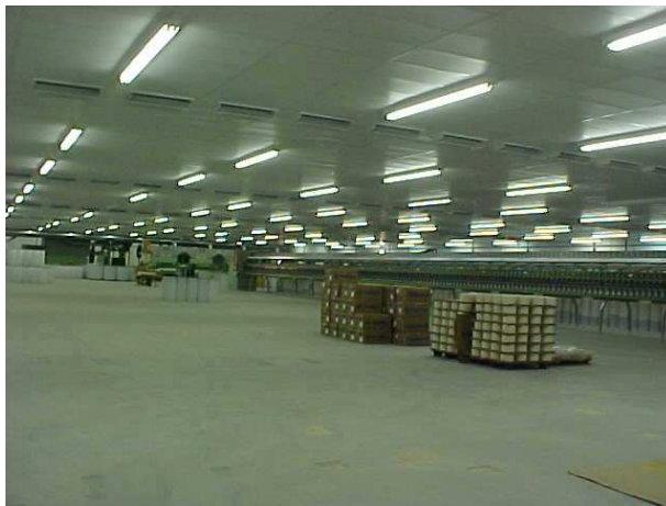
Maliber – Itatiba/SP