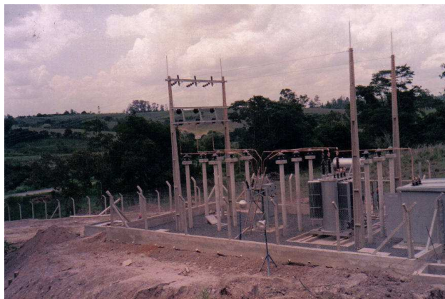
Subestação Corumbataí Metais