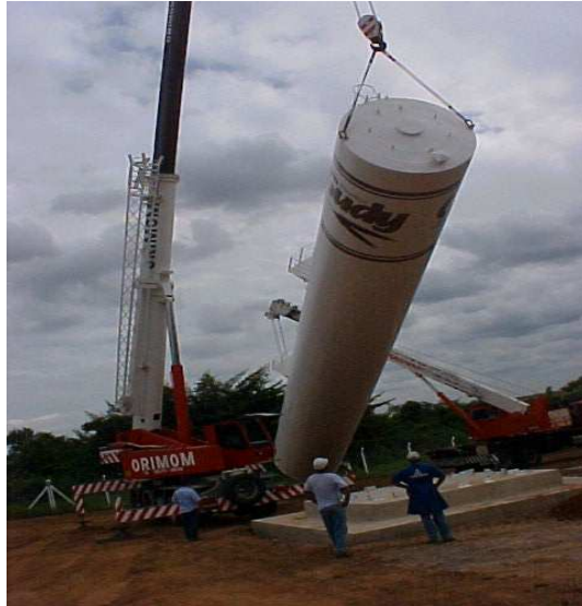
R.J. Biscoitos - Rio Claro/SP