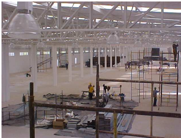
R.J. Biscoitos - Rio Claro/SP