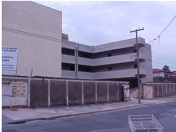
Escola Crescer – Campinas/SP